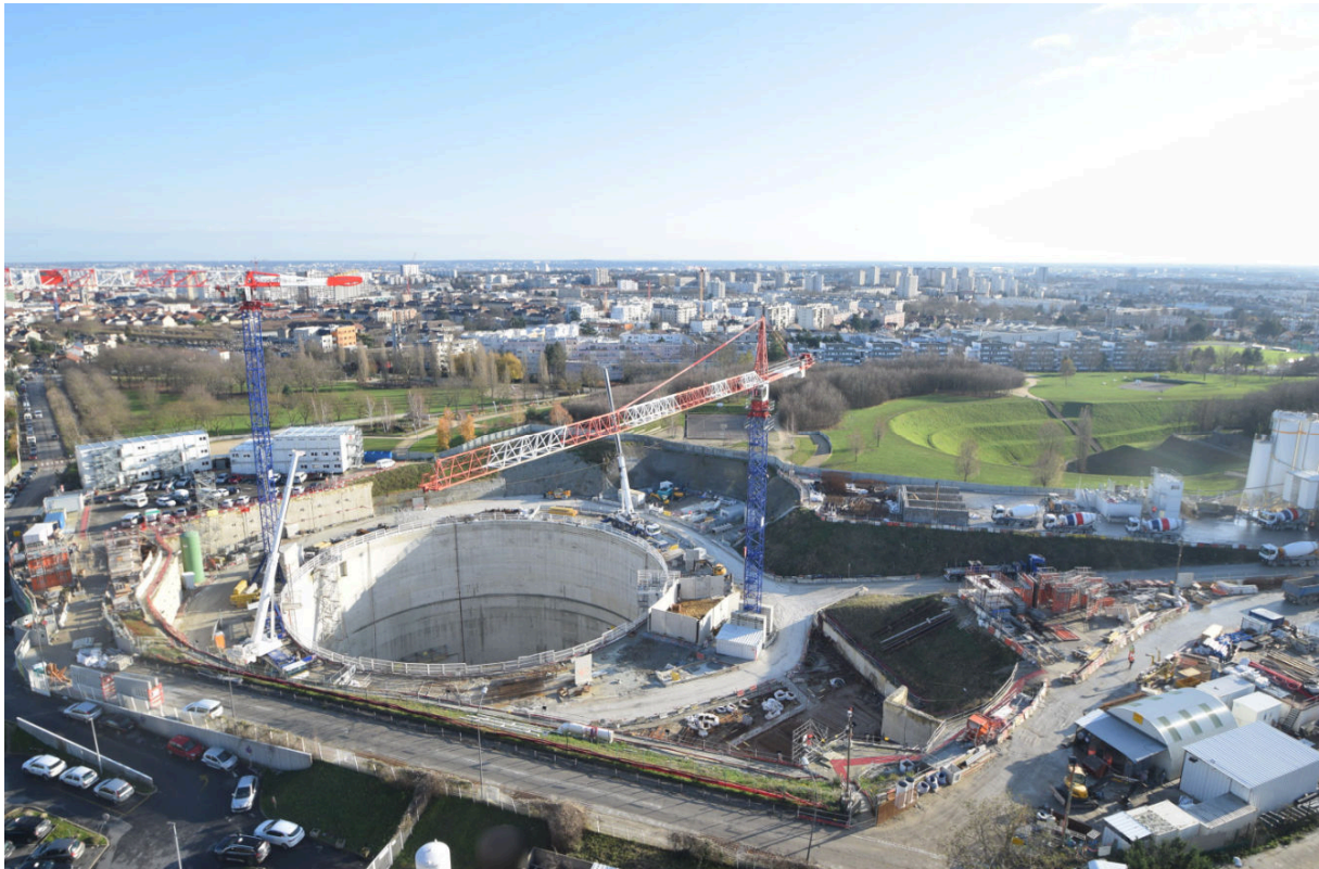
Chantier de la future gare de Villejuif IGR

Au programme de cet événement : un spectacle pyrotechnique créé par Groupe F, une mise en lumière artistique du puits, un live musical de Jaffna, une installation de l'artiste Iván Navarro et l'exposition « archéologie du futur » plongeront les participants dans une ambiance festive et artistique. Les plus jeunes profiteront également des ateliers jeunesse, sans oublier le traditionnel gigot bitume offert à tous !