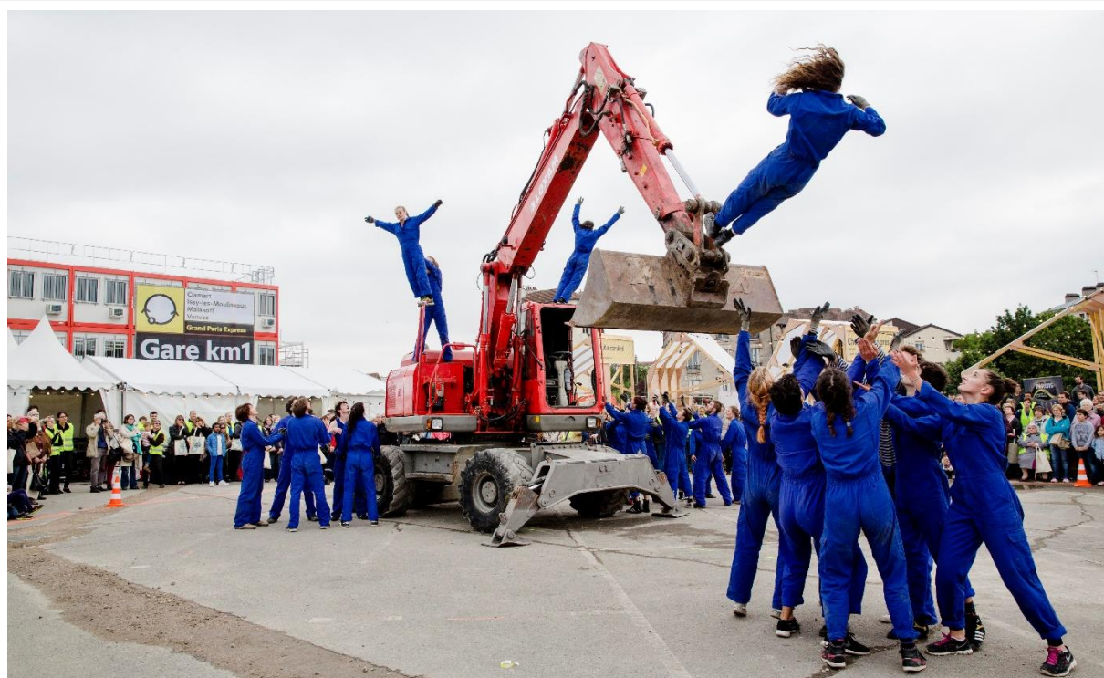
KM1 à Fort d'Issy Vanves Clamart – Lancement du premier chantier

La cérémonie d'inauguration des deux tunneliers en présence des élus débutera à 18h30.