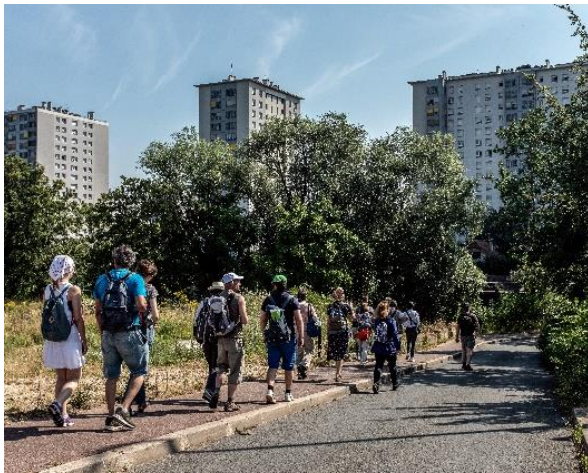
Balade urbaine L15 Sud, 2018

Depuis le chantier et en bord de Seine, les habitants et riverains pourront découvrir le quartier en pleine mutation des Ardoines. Ce site de 300 hectares au riche patrimoine industriel est amené à devenir un pôle majeur du Grand Paris de demain desservi par la future gare des Ardoines sur la ligne 15 du Grand Paris Express.